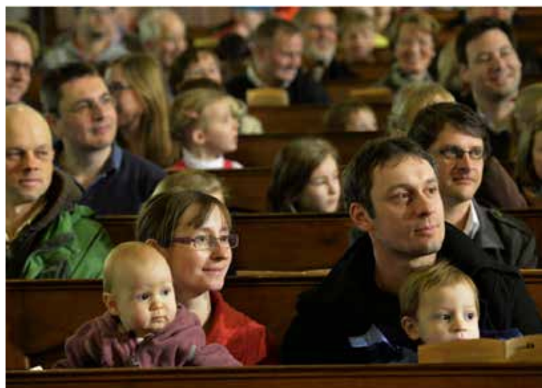
Gute seelsorgerliche Begleitung braucht kein Pfarrhaus.

Mit Überraschung habe ich vor kurzem von Theologiestudierenden gehört, wie kontrovers und kritisch sie das hier angesprochene Thema diskutieren - ganz anders, als noch zu meinen Studentenzeiten. Hier wird nicht nur über den baulichen Zustand zukünftiger Wohnstätten gesprochen, nicht nur darüber, ob man das später auch bezahlen kann (vor allem die Heizkosten), son-