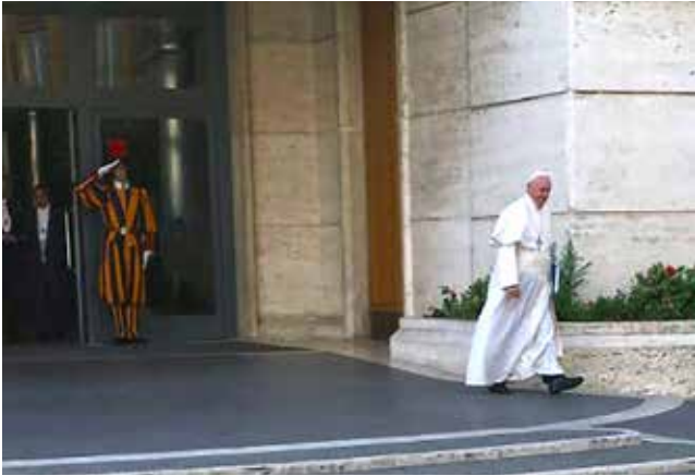
Papst verlässt die XIV. Ordentliche Bischofssynode in Rom

Die Bischofssynode in Rom im Oktober 2015 fand nicht nur in der Aula des Vatikans statt, sondern auch in den Medien: Das Outing eines homosexuellen Vatikan-Prälaten, ein gepfeffertes Protestbrief von konservativen Kardinälen, Gerüchte über eine Hirn-Erkrankung des Papstes machten die Runde. All das ließ auf verhärtete Fronten schließen unter den 270 Bischöfen.