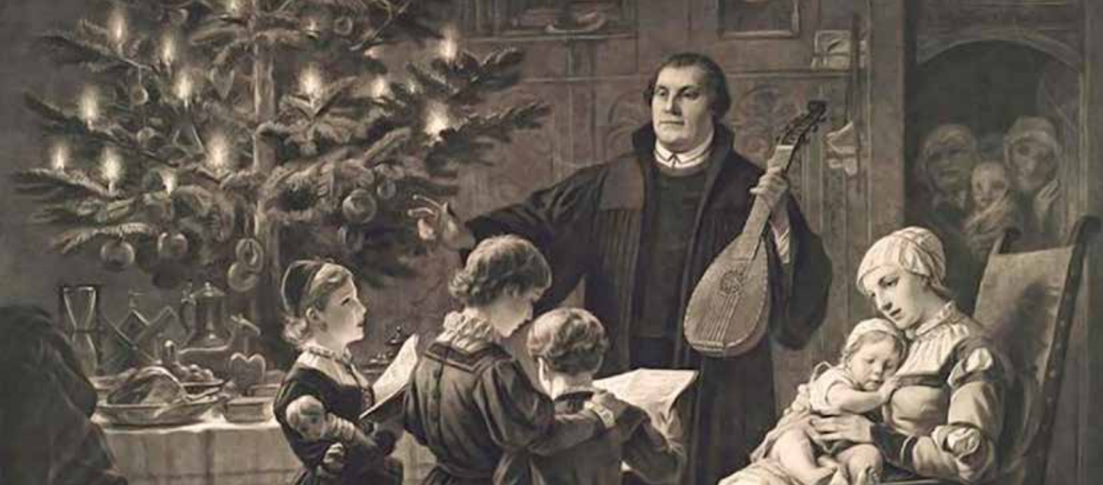
Heiligabend im Hause Luther, wie ihn sich der Künstler Bernhard Plockhorst im 19. Jahrhundert vorstellte.