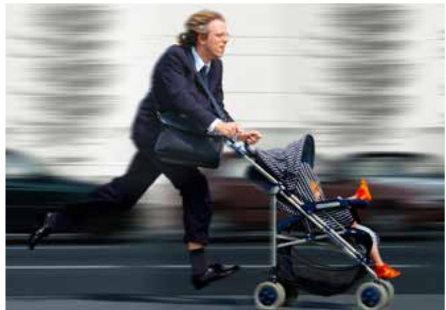
Ein Leben zwischen Beruf und Familie