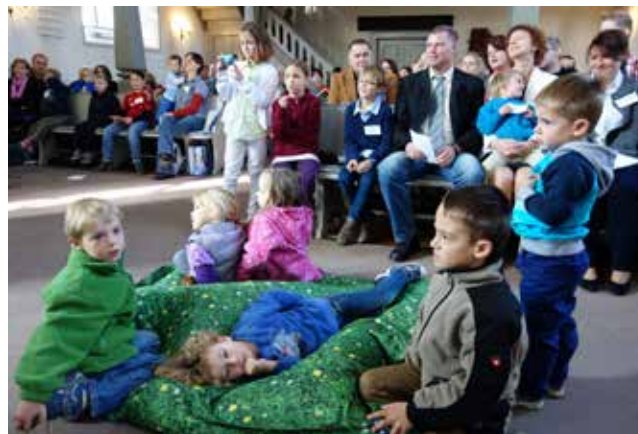
Familiengottesdienst: Auch für Pfarrfamilien eine Oase?

Das alles sind Herausforderungen, vor denen insbesondere Pfarrerrinnen und Pfarrer stehen. Denn zusätzlich zu den Schwierigkeiten, die alle berufstätigen Eltern von (kleinen) Kindern haben, kommen im Pfarrberuf folgende Faktoren hinzu: unregelmäßige Arbeitszeiten, Arbeitszeiten außerhalb von regulären Betreuungszeiten der Kinder, Präsenzpflicht, Residenzpflicht, viele (erzwungene) Umzüge, hohe Belastung zu Zeiten, an denen andere frei haben.