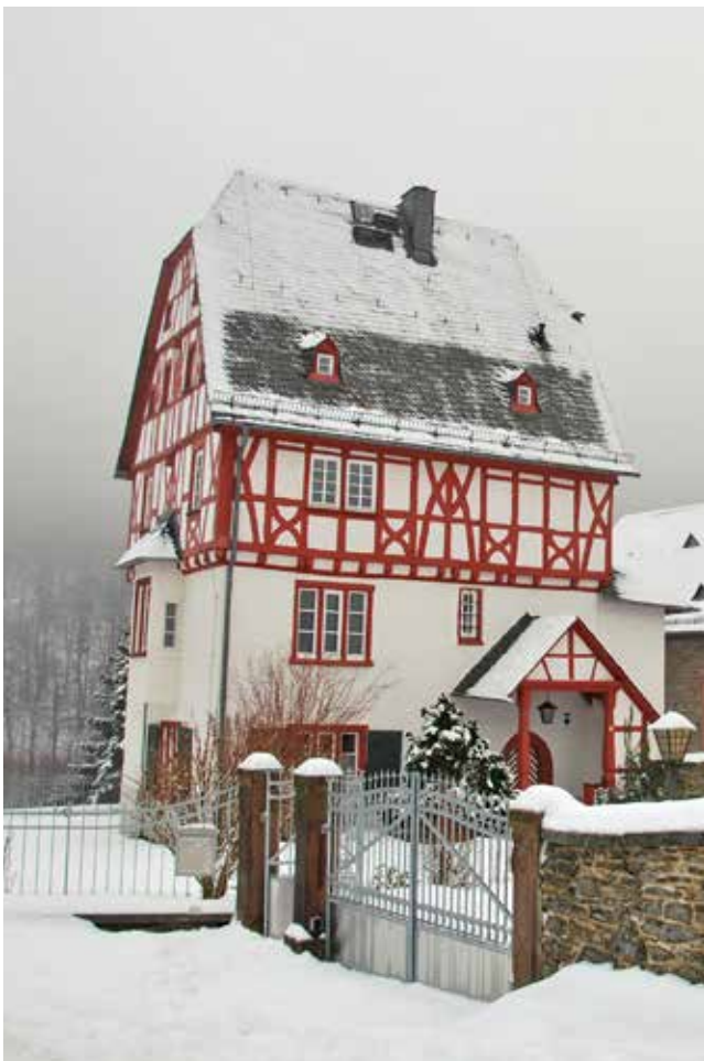
Das Pfarrhaus in Rod an der Weil gilt als das älteste Pfarrhaus in Deutschland.

Pfarrhaus hat auch zu tun mit Bildung und Kultur, da ist vor Ort präsent eine Bibliothek, da ist ein belesener Mensch, ein politisch oder gar kommunalpolitisch denkender, ein Pädagoge, da ist oft auch noch ein Musikinstrument, da ist Sinn für Schönes. Pfarrhaus erzählt eine Geschichte, die offene Geschichte einer Familie, viele Geschichten aus der reformatorischen Tradition, wichtige Menschen kommen aus dieser Geschichte, sind geprägt von ihr. Pfarrhaus hat zu tun mit Diakonie. Da wurde schon oft und immer wieder geholfen, ganz praktisch, erste und letzte Hilfe. Pfarr-