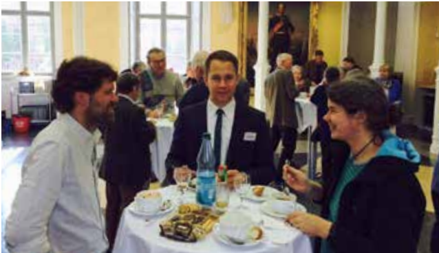
Angeregte Gespräche während der Mittagspause

Mehr als 125 Teilnehmende besuchten vom 8. bis 11. Oktober 2015 die 107. Generalversammlung des Evangelischen Bundes in Greifswald. Die Tagung fand in diesem Jahr in Kooperation mit der Theologischen Fakultät der Ernst-Moritz-Arndt-Universität Greifswald statt.