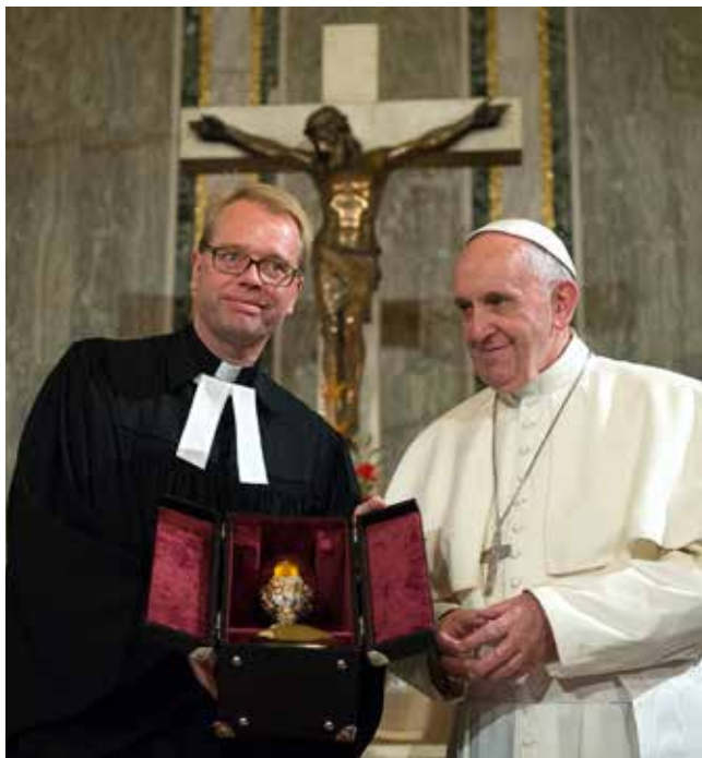
Papst Franziskus überreicht Abendmahlskelch als Gastgeschenk an die lutherische Gemeinde in Rom