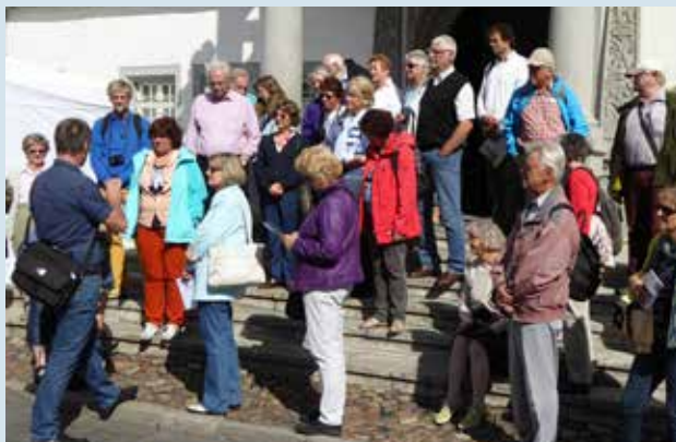
Interessierte Zuhörerschaft des EB Bayern bei einer Führung in Wittenberg