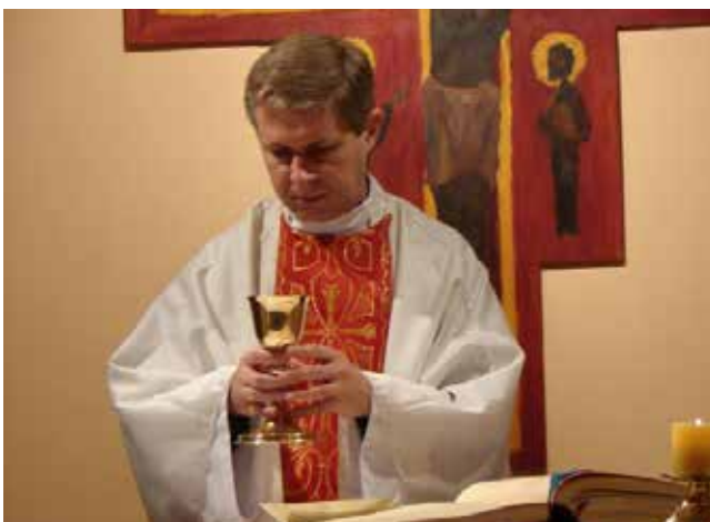
Das Berufsbild Priester im Wandel

Angesichts der abnehmenden Zahl von Kandidaten für das Priesteramt müssen sich viele Bischöfe überlegen, wie sie die pastorale Versorgung ihrer Gemeinden garantieren. Dies wird in der Regel mit dem eingangs zitierten Motto angegangen. Gemeinden werden zu „Seelsorgeeinheiten“, „Pfarreigemeinschaften“, „pastoralen Räumen“ verschmolzen, denen ein „Pastoralteam“ zugeordnet wird. Regional unterschiedlich werden diese „Teams“ verschieden zusammengesetzt. Unabdingbar bleibt aber, dass der Einsatz des Ehrenamtes in den Gemeinden weiter ausgebaut wird. Eine Frage begleitet diese Notwendigkeit: Wenn die Ehrenamtlichen immer mehr Aufgaben in den Gemeinden übernehmen, verändert sich dann nicht das Bild der Kirche? Sicher ist, dass es neue Beauftragungen von Laien geben wird und diese damit praktisch gesehen mehr Dienste in der Kirche übernehmen. Vor allem in Bereichen wie dem Glaubensunterricht, den diakonischen Aufgaben oder den liturgischen Diensten wird sich die Kirche immer mehr auf ehrenamtliches Engagement verlassen müssen. Soziologisch ist dabei der Aspekt interessant, dass vor allem Frauen sich ehrenamtlich in ihrer Kirche engagieren. Diese Beobachtung ergibt als Nebengleis der eigentlichen Frage eine besondere Zuspitzung: Wenn immer mehr Frauen Amtsfunktionen ausüben, wird dann der Ruf nach einem „weiblichen“ Amt nicht immer lauter? Wird die Frage nach der Frauenordination durch das Ehrenamt verschärft?