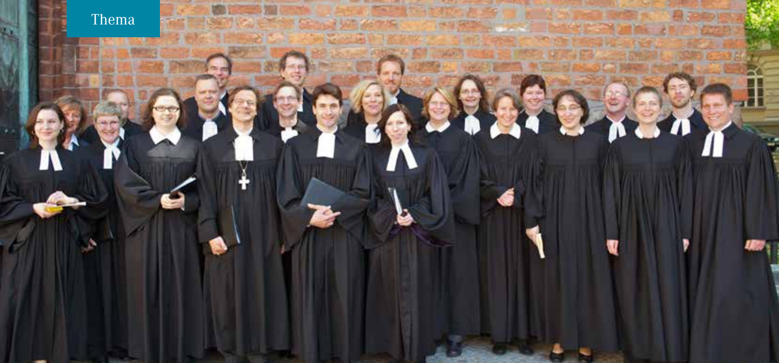
Junge PfarrerInnen in Berlin bei ihrer Ordination