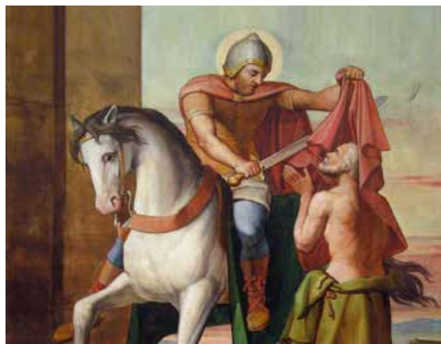
Symbol der Barmherzigkeit: St. Martin teilt seinen Mantel mit einem Bettler

die Verletzung eines Rechtsguts ist, und in Hinsicht auf den Täter danach, wie sehr sie ihm vorzuwerfen ist. Wenn ihm bei der Tat wegen eines unvermeidbaren Irrtums die Einsicht fehlt, Unrecht zu tun, oder wenn er aus bestimmten anderen Gründen (z.B. eine psychische Krankheit) dies nicht erkennen kann, handelt er ohne Schuld und wird nicht bestraft. Im Recht der öffentlichen Verwaltung bestehen oft Ermessensspielräume, so dass im Rahmen der rechtlichen Vorgaben nach angemessenen Lösungen für den Einzelfall zu suchen ist. Recht ist somit nicht bloß der Vollzug eines vorgeschriebenen Programms, sondern immer zugleich die angemessene Bewältigung eines konkreten Falls. Für alle Rechtsgebiete gilt der Grundsatz des fairen Verfahrens. Die Betroffenen sollen die Chance haben, ihre Sicht der Dinge vorzutragen und gehört zu werden. Das ist aufwändig und kostet Zeit. Aber es ist die Bedingung dafür, dass jeder Einzelfall in seiner Besonderheit wahrgenommen und gewürdigt wird.