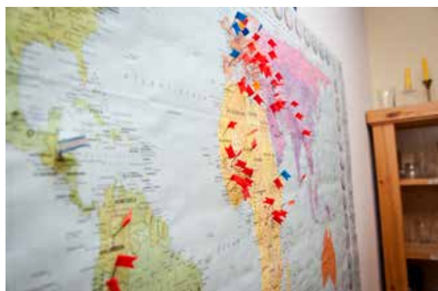
Eine Landkarte zeigt die zahlreichen Herkunftsländer derzeit in Deutschland Asylsuchender

Im letzten Jahr haben wir Flüchtlingsbeauftragte der Kirchen durch Verhandlungen und Gespräche, aber auch durch unsere intensive Öffentlichkeitsarbeit versucht, die politischen Hintergründe, die zu Kirchenasyl führen, zu thematisieren und zu ändern. Bei der vorübergehenden Aussetzung der Dublin-Verordnung für syrische Kriegsflüchtlinge ist uns das im vorigen Sommer gelungen. Ein großer Erfolg war auch die auf bayerische Initiative erfolgte Etablierung des deutschen Härtefallverfahrens für Dublin. Wir konnten die besondere Not von ins Kirchenasyl genommenen Menschen dem Bundesamt für Migration und Flüchtlinge vortragen. In der Folge wurde in 2015 für jeden der mehr als 100 eingereichten Fälle eine entsprechende Anerkennung, Aufnahme in das aussichtsreiche deutsche Asylverfahren und vorzeitige Beendigung des Kirchenasyls erreicht. Diese Vereinbarung hat auch zu einer weiteren Respektierung und Tolerierung der Kirchenasyltradition geführt.