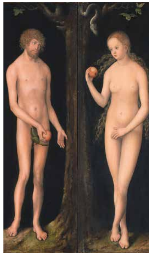
Adam und Eva, Lucas Cranach der Ältere (1472-1553)

Der Gedanke der Vergöttlichung wird aus dem Neuen Testament begründet. Verse wie Röm 8,29 sind dabei grundlegend: „Denn die er ausersehen hat, die hat er auch vorherbestimmt, dass sie gleich sein sollten dem Bild seines Sohnes, damit dieser der Erstgeborene sei unter vielen Brüdern.“ Auch in 1Kor. 15,49 – 53 geht es um Theosis, wenn dort von einer Verwandlung hinein in die Unsterblichkeit die Rede ist: „Und wie wir getragen haben das Bild des irdischen, so werden wir auch tragen das Bild des himmlischen. ...wir werden ... alle verwandelt werden... Denn es wird die Posaune erschallen und die Toten werden auferstehen unverweslich, und wir werden verwandelt werden. Denn dies Verwesliche muss anziehen die Unverweslichkeit, und dies Sterbliche muss anziehen die Unsterblichkeit.“