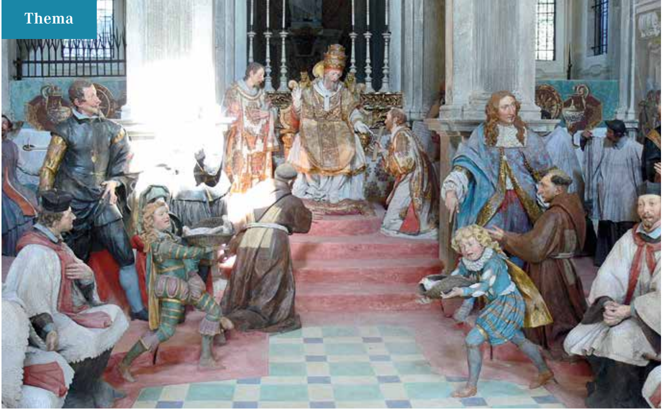
Heiligsprechung des heiligen Franz von Assisi durch Papst Gregor IX. in der Kapelle 20 im Sacro Monte di Orta.