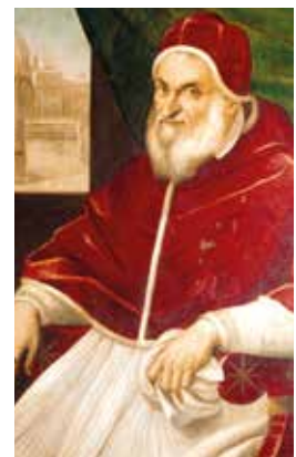
Papst Sixtus V. (1521-1590)

In den 500 Jahren bis zum Ende des 15. Jahrhunderts wurden gerade einmal 119 Personen heiliggesprochen. Die Reformation übte ihren mäßigenden Einfluss auf diese Praxis insofern aus, als von 1523 bis 1588 niemand heiliggesprochen wurde. Erst mit dem unter Sixtus V. neu geordneten System der römischen Kurie, wo nun die sogenannte Ritenkongregation für die Heiligsprechungen zuständig war, setzten die Prozesse wieder ein.