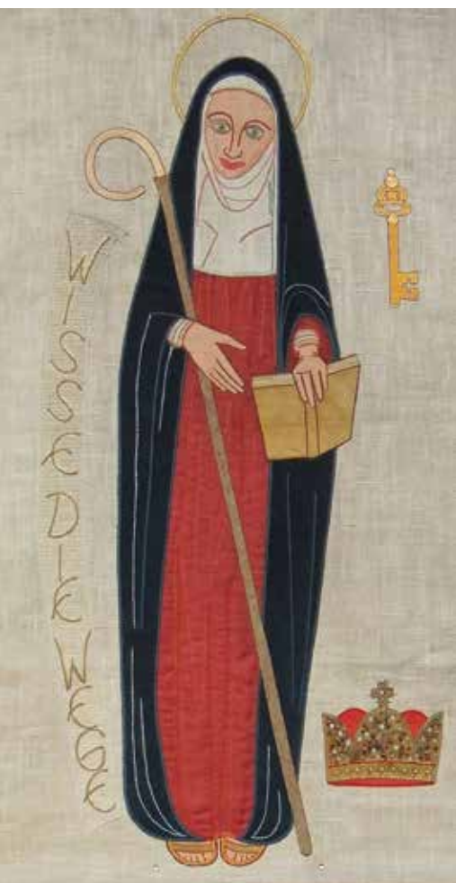
Wandteppich mit einem Bildnis von Hildegard von Bingen aus der Heilig-Geist-Kirche in Frankfurt am Main.

die sich aus Katholiken und Nichtkatholiken, auch Angehörigen anderer Religionen, zusammensetzt, aus Gläubigen und Ungläubigen.