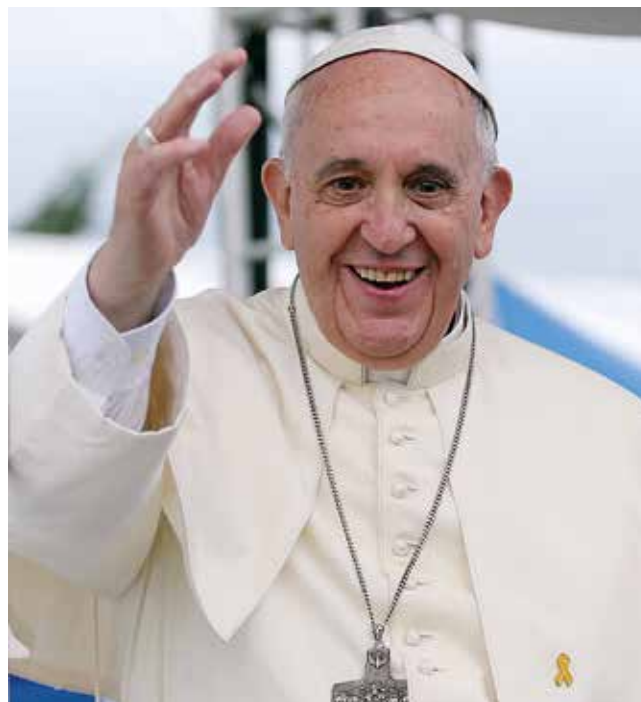
Papst Franziskus sprach in zwölf Jahren 942 Menschen heilig, darunter die 813 Märtyrer von Otranto.