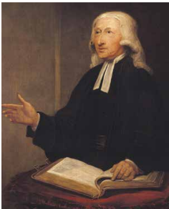
John Wesley (1703-1791) Mitbegründer der methodistischen Bewegung

Eine solche Reformbewegung bildete sich in der ersten Hälfte des 18. Jahrhunderts in England um die Brüder John und