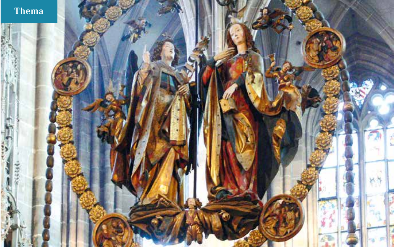
Nach Einführung der Reformation 1525 zunächst verhängt: der Engelsgruß in der Nürnberger St. Lorenzkirche.