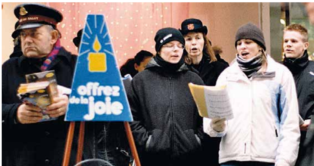
Mit Musik und oftmals in Uniformen macht die Heilsarmee auf ihr Anliegen, Bedürftigen zu helfen, aufmerksam.

Die Bedeutung der Heiligungsbewegung (im engeren Sinne) für die Entwicklung des Christentums in Nordamerika und Europa tritt besonders dann hervor, wenn man sich vor Augen führt, welche Kirchen und Bewegungen wiederum aus dem „Holiness Movement“ hervorgegangen sind. In den 1860er Jahren entstand die „Heilsarmee“ („The Salvation Army“), die die Ausgegrenzten und Bedürftigen zum Glauben führen und ihnen zugleich materiell, körperlich und seelisch helfen wollte, sodass sie ein ausgesprochen diakonisches Profil entwickelte. Mitte der 1880er Jahre gründete sich die „Church of