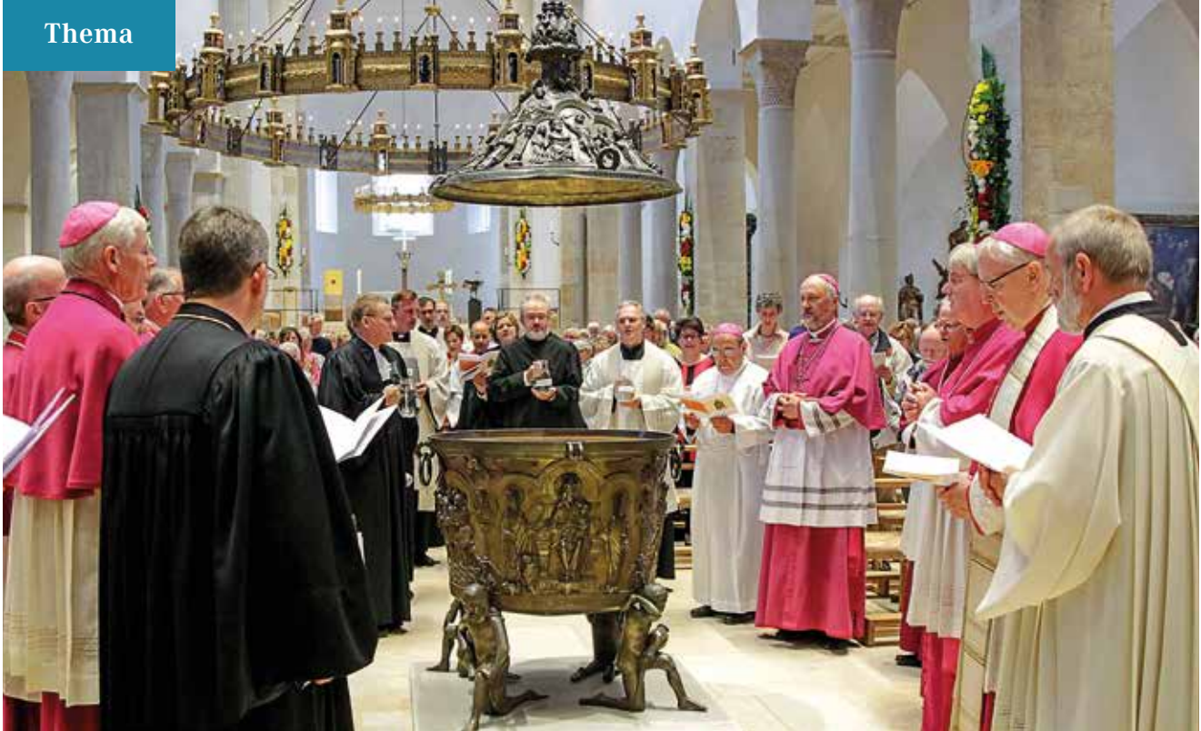
Ökumenische Taufvesper im Hildesheimer Dom 2017